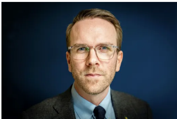
Infrastrukturminister Andreas Carlson är överens med sina nordiska kolleger.

Också vägarnas bärighet ska förbättras. Det är viktigt för näringslivet i fredstid men också i ett läge med höjd beredskap och andra kriser och krig där man behöver möjlighet till värdlandsstöd och truppförflyttningar över svenskt territorium, säger Carlson.