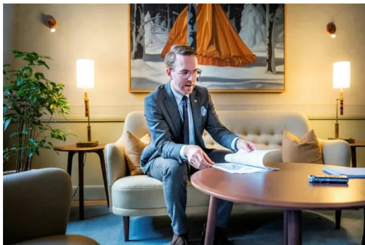
Infrastrukturminister Andreas Carlson tycker att försvarets behov behöver styra i större utsträckning.

Det framgår i en ny strategi som de fem ländernas infrastrukturdepartement tagit fram tillsammans.